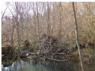
Biberbau, gut versteckt im Gebüsch

Alle Angaben stammen von „Hallo Biber“. In den nachfolgenden Links finden Sie zudem viele weitere interessante Informationen zum Biber. http://www.hallobiber.ch/ www.biberfachstelle.ch/