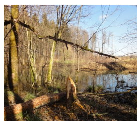
Der Biber als Waldarbeiter