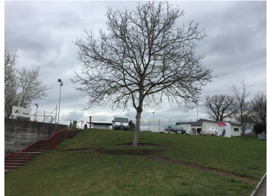
Bild: Der Garten mit dem markanten Nussbaum im Zentrum befindet sich zwischen der Mehrzweckhalle und dem HSV-Parkplatz. Erste Geländearbeiten wurden bereits letzten Herbst in Angriff genommen; erste Sitzplätze um den Nussbaum und Gehwege sind gestaltet worden.

Anhalten, durchatmen, jeder kann mitmachen, ohne Anmeldung, einfach vorbei kommen und informieren. Vorlieben, Bedürfnisse und Möglichkeiten werden gemeinsam besprochen und angepackt.