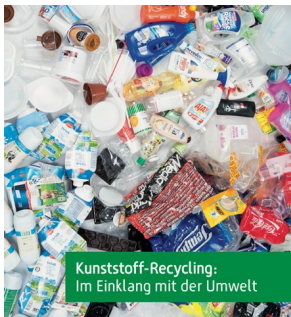
Kunststoff-Recycling: Im Einklang mit der Umwelt

Kunststoffe können wie andere Werkstoffe wiederverwendet werden. Das spart Rohstoffe und schont die Umwelt.